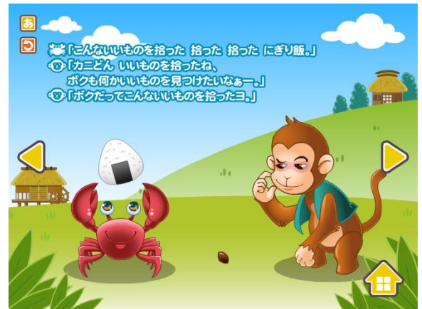
再生画面。タップすると絵が動くなどインタラクティブな仕掛けも満載。