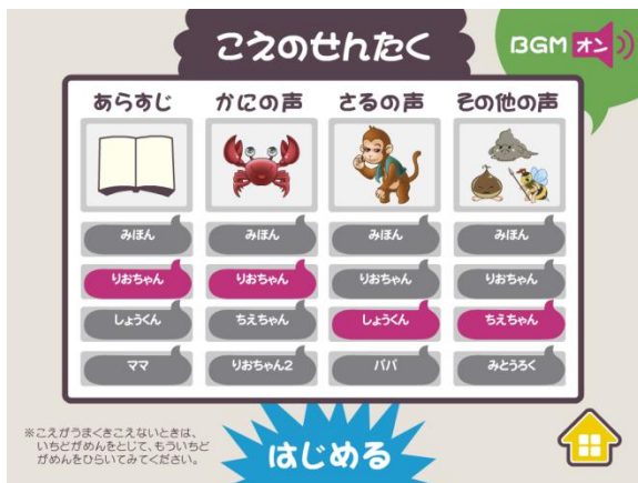
あらすじ、役ごとに3データまで保存可能。 好きな声を選んで再生。